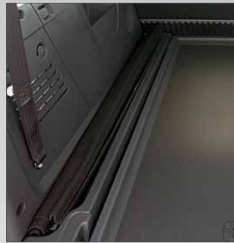
Vano Alloggiamento Copribagagli