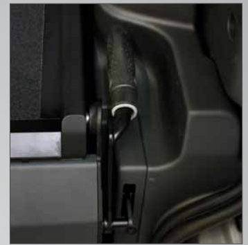
Impugnatura ergonomica per apertura rampa.