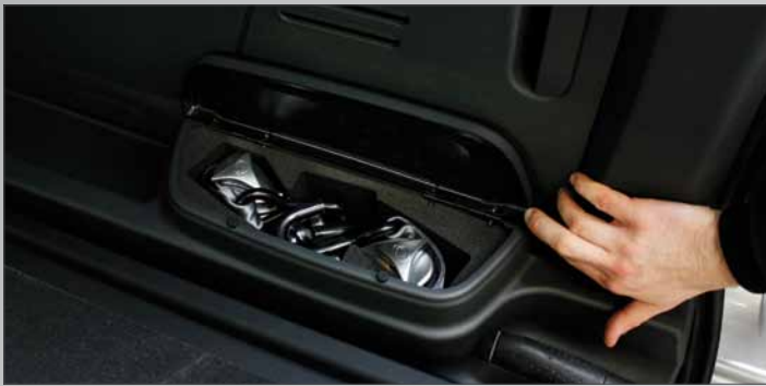
Vasca alloggiamento ancoraggi